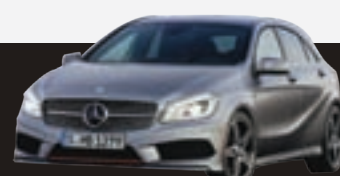
NUEVO CLASE A